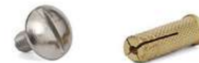
Anclaje Poelier para las carracas