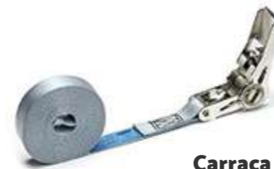
Carraca 25m en INOX