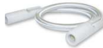
Conjunto tensor de 50cm regulable para los amarres anti viento