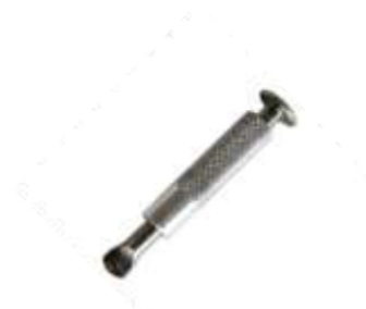
Anclaje Escamoteable para los amarres anti viento