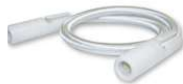
Conjunto tensor de 50cm regulable

Pica en acero inoxidable de 50cm Pica en acero inoxidable de 25cm