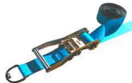
Carraca 50 cm